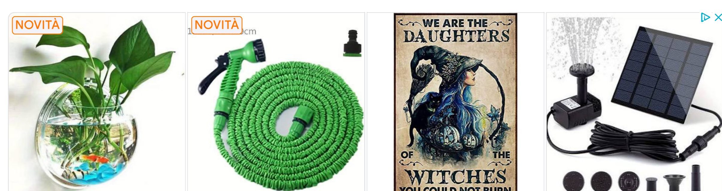
Saldi di Apertura

CNR-IFN organizza la quarta edizione del concorso FOTONICA IN GIOCO. Il concorso è rivolto a tutti gli studenti degli istituti secondari di secondo grado italiani e ha come scopo la realizzazione di un gioco da tavolo originale con carattere didattico o divulgativo. La cerimonia di premiazione avverrà contestualmente a quella del Premio Archimede e vedrà la partecipazione delle classi che avranno realizzato i tre migliori progetti.