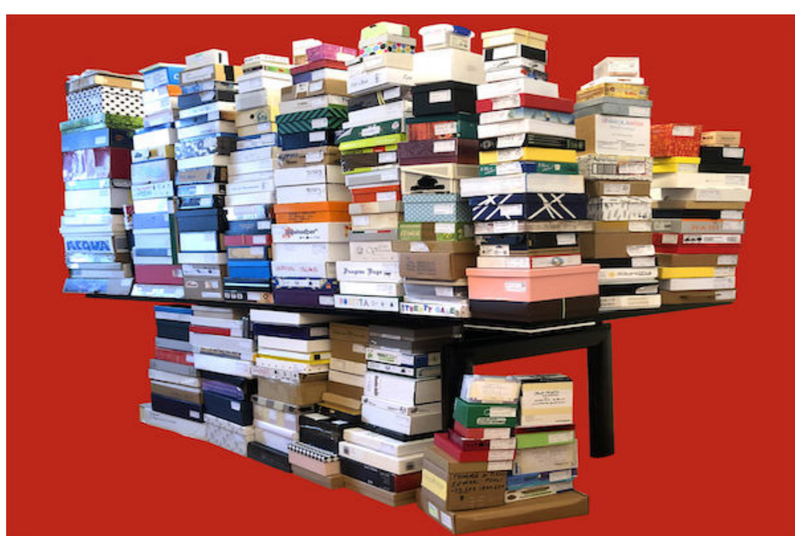
I prototipi dell'edizione 2021 (per gentile concessione di Studiogiochi)

Pertanto non sorprende che quasi ad ogni nuovo appuntamento sia aumentato il numero dei giochi da valutare. L'edizione 2023 ha stabilito il nuovo record con 238 prototipi arrivati dall'Italia e dal resto del mondo. Nel gruppo dei 24 finalisti ci sono anche un autore spagnolo e uno americano.