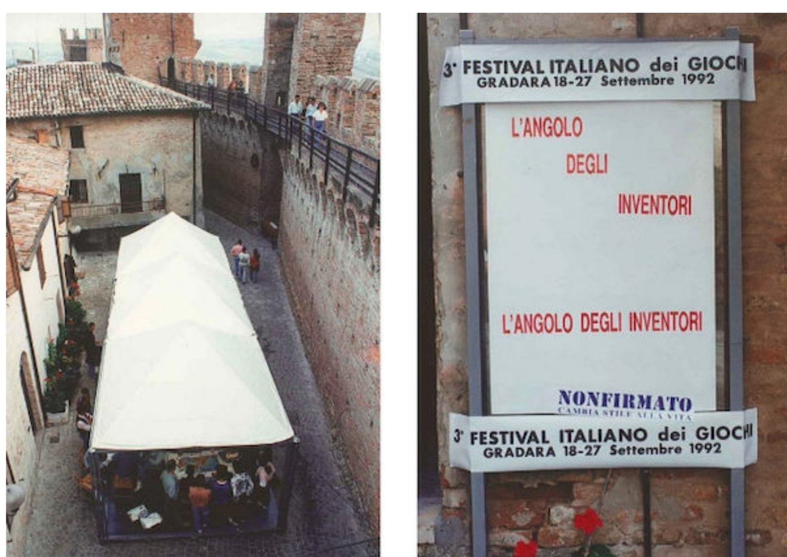
Dove si è accesa la "lampadina" di Archimede

Dal 2004 il Premio è dedicato ad Alex Randolph (1922-2004), famoso inventore di giochi – forse il primo a trasformare questa passione in un lavoro – che è stato presidente del Premio Archimede per le prime sette edizioni.