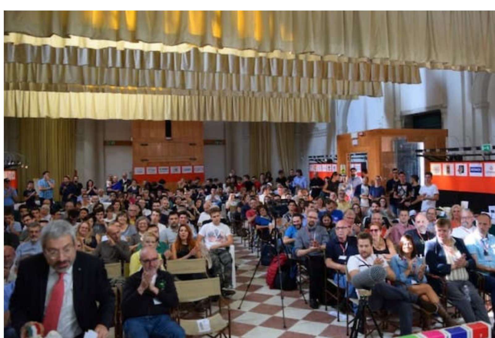
La sala dell'edizione 2021 del Premio Archimede

Poi c'è un evento. Si chiama Premio Archimede ed è dedicato agli inventori di giochi e alle loro creazioni ludiche inedite . Il Premio Archimede si svolge proprio a Venezia ed è gestito da Studiogiochi.